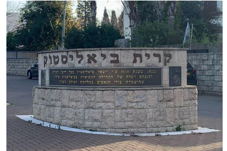
הכניסה לקריית ביאליסטוק