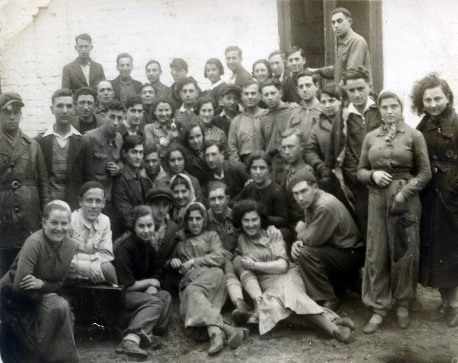
הכשרה ציונית בביאליסטוק לפני עליה לא"י - גרעין עמל 5 ( 1938 )