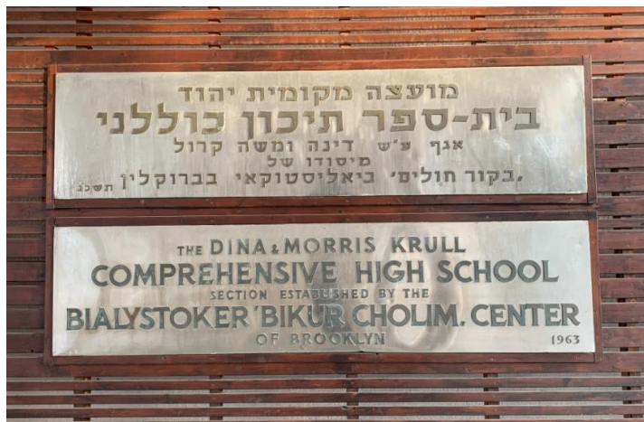
בית ספר תיכון מקיף יהוד