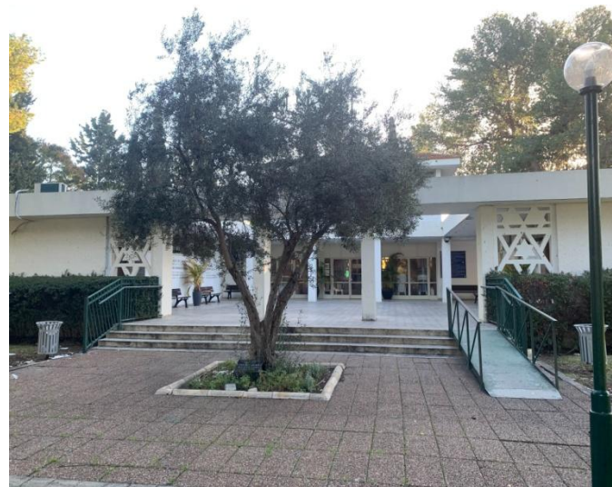
בית הכנסת ע"ש שמואל מוהליבר