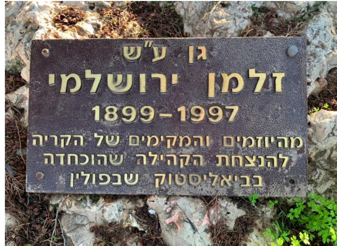
גן ע"ש מייסד הקריה