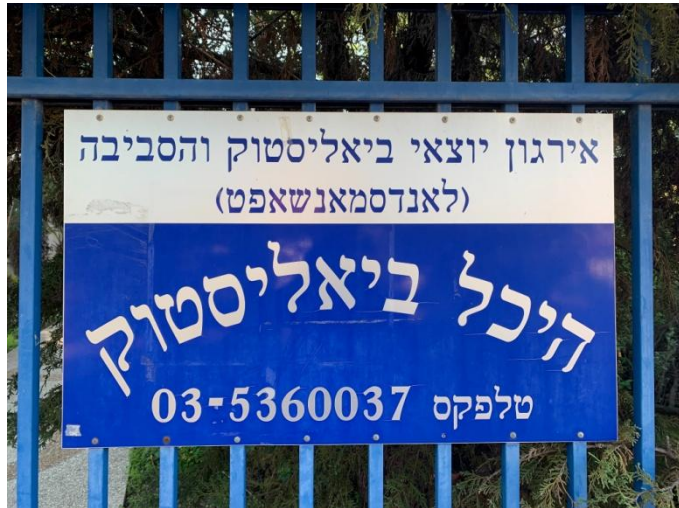
מרכז הנצחה ("בית העם")