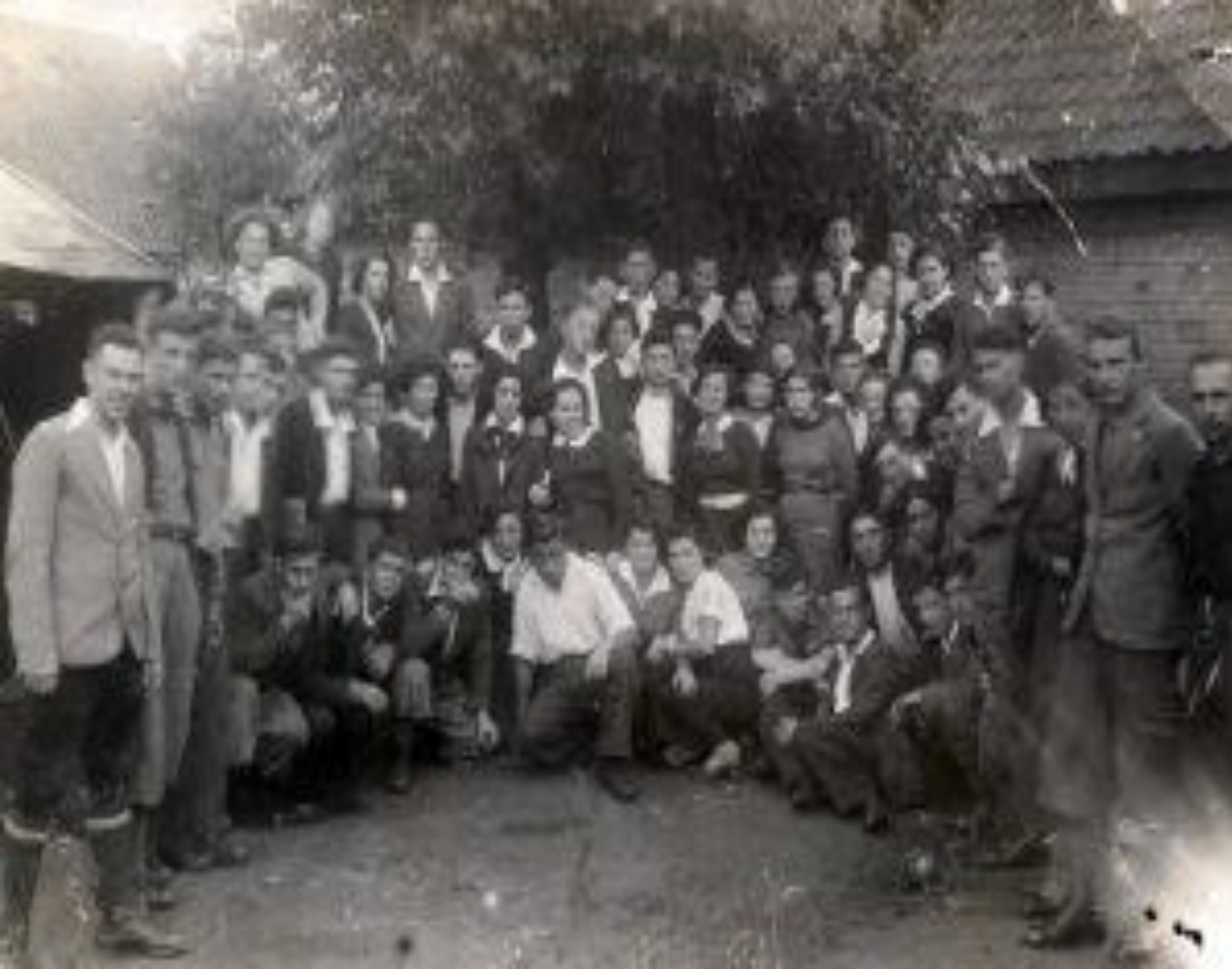
הכשרה ציונית בביאליסטוק בנתיב העלייה לא"י- גרעין עמל 2 של "השומר הצעיר" ( 1935)